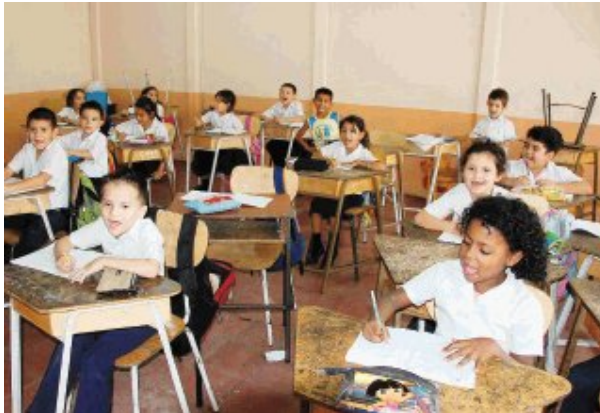
En la escuela Miguel Obregón de Alajuela solamente funciona un grupo de primer grado con 35 estudiantes, debido a la baja de la matrícula por la disminución de la natalidad en el país. Francisco Barrantes